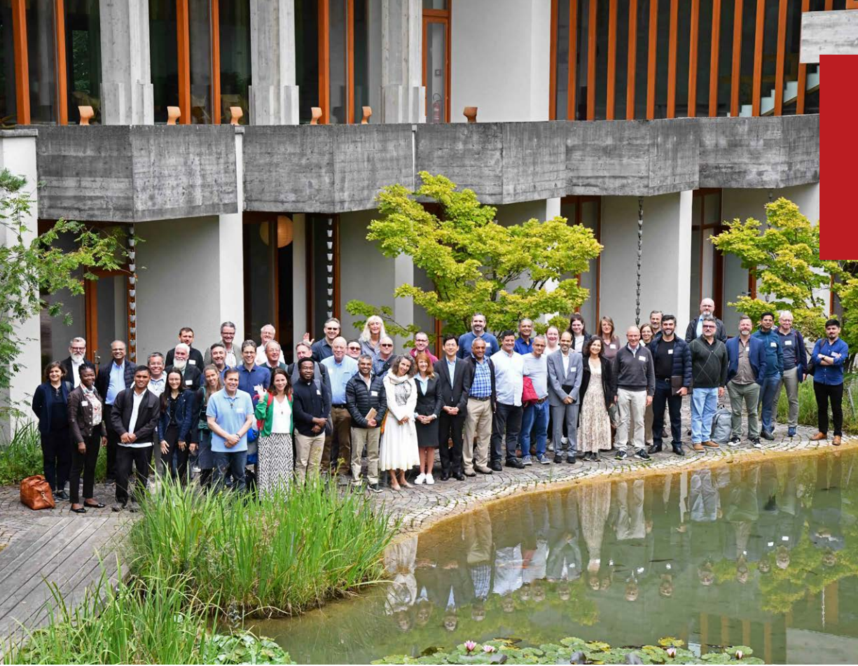
Die Teilnehmenden der Biennial Conference on Environmental Justice

Die Gesprächsrunden werden jeweils von Fachpersonen aus dem Kreis der Lassalle-Institut-Community moderiert. Sie geben Impulse zum jeweiligen Thema aus der Tradition der Spiritualität der Jesuiten, die zum Austausch anregen. Hierbei stellt die Vermittlung theoretischen Wissens nur einen kleinen Teil des angestrebten Ziels dar: Das Format des Zirkels ist vom gemeinsamen Grundsatz der ignatianischen Spiritualität und der modernen empirischen Psychologie geprägt, nach dem das Entstehenlassen innerer Bilder und das Befassen mit der eigenen Biografie essenziell für die Entwicklung reifer (Führungs-)Persönlichkeiten ist. Die Impulse wirken somit auf eine Verbindung von explizi-