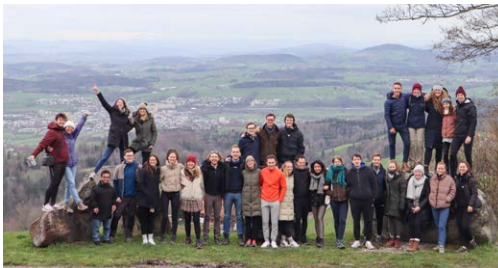
Der 24. Jahrgang der Bayerischen EliteAkademie zu Gast im Lassalle-Haus

Diese Fragen stehen im Vordergrund der Retreats, die das Lassalle-Institut jüngeren Menschen anbietet, die sich während ihres Studiums auf ein Wirken in Führungsverantwortung vorbereiten. Wir führen solche Formate jährlich für die Bayerische EliteAkademie sowie auch für die Schweizerische Studienstiftung durch. Das Institut begleitet diese jungen Erwachsenen darin, Wege zu sich selbst, zu anderen und zu einem guten, verantwortlichen Entscheiden zu finden. Mit Hilfe der christlichen und östlichen Traditionen wird den Teilnehmenden der Zugang zu Erfahrungswissen ermöglicht, das sich dem kognitiven Begreifen allein entzieht. Nicht nur der Kopf, sondern auch Herz und Hände werden angesprochen: Wie fühlt sich das aktuelle Leben an? Was gibt Lebensenergie, was bremst uns? Was will in uns wachsen?