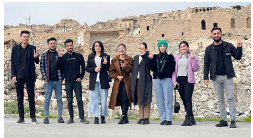
Kurdische JWL-Studierende aus dem Nordirak