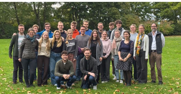
Treffen des neuen Jahrgangs 2025