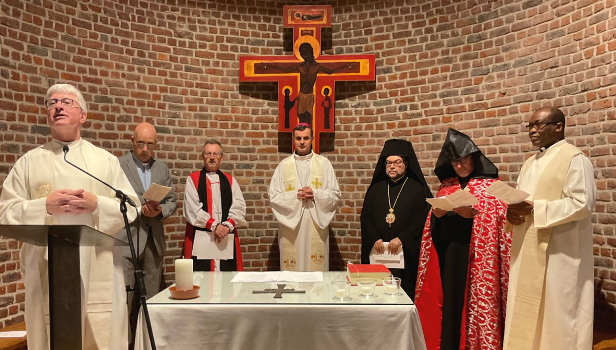
Ökumenisches Gebet nach der Sommerpause

Themenabende. In den meisten europäischen Institutionen gibt es kleine Gebetsgruppen, in denen sich Kolleginnen und Kollegen regelmäßig für ein kurzes Gebet zusammenfinden – in ihren Büros oder in der Chapel . Andere Abendveranstaltungen dienen dem Austausch über die „Seele Europas“, die aktuellen Herausforderungen, die Zusammenarbeit der Kirchen und Religionen.