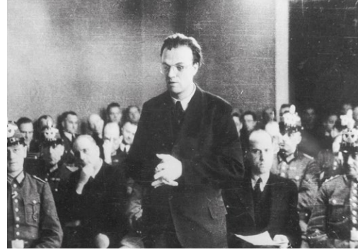
Alfred Delp am 9. Januar 1945 vor dem Volksgerichtshof in Berlin, der ihn verurteilte und hinrichten ließ

Mit einem feierlichen Gottesdienst im Münchner Liebfrauenom hat Kardinal Reinhard Marx Anfang Februar das Seligsprechungsverfahren für den Jesuiten und Widerstandskämpfer Alfred Delp eröffnet. „Für die Nationalsozialisten war Alfred Delps christliche Überzeugung von der Freiheit und Würde aller Menschen eine solche Bedrohung, dass sie ihn gefangengenommen, gedemütigt und schließlich hingerichtet haben“, sagte Kardinal Marx. „Wir beginnen sein Seligsprechungsverfahren in dem Bewusstsein, dass auch heute die Stimmen wieder lauter werden, die in der Unterdrückung anderer Menschen ein Zeichen von Stärke sehen. Ihnen stellen wir uns entgegen: Nicht Gewalt, Hass und Nationalismus machen eine Gesellschaft stark, sondern Menschlichkeit, Gerechtigkeit und Freiheit.“