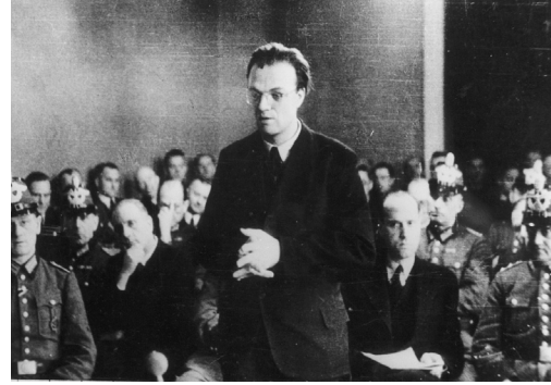
Alfred Delp am 9. Januar 1945 vor dem Volksgerichtshof in Berlin, der ihn verurteilte und hinrichten ließ

Pater Alfred Delp SJ (1907–1945) trat 1926 in den Jesuitenorden ein, wurde Redakteur bei den Stimmen der Zeit und später Kirchenrektor in St. Georg in München. In seinen Predigten und Artikeln wandte er sich gegen die Ideologie der Nationalsozialisten und deren feindliche Haltung gegenüber dem Christentum. Im Frühjahr 1942 bekam Delp Kontakt zum „Kreisauer Kreis“ um Helmuth James Graf von Moltke. Diese Gruppe von Intellektuellen und Politikern stellte sich gegen das Regime und beschäftigte sich mit den Fragen einer künftigen Gesellschaftsordnung. Aufgrund dieser Kontakte wurde Alfred Delp Ende Juli 1944 verhaftet und wegen Hoch- und Landesverrats angeklagt. Nach seiner Verurteilung wurde er am Nachmittag des 2. Februar 1945 in Berlin-Plötzensee gehängt.